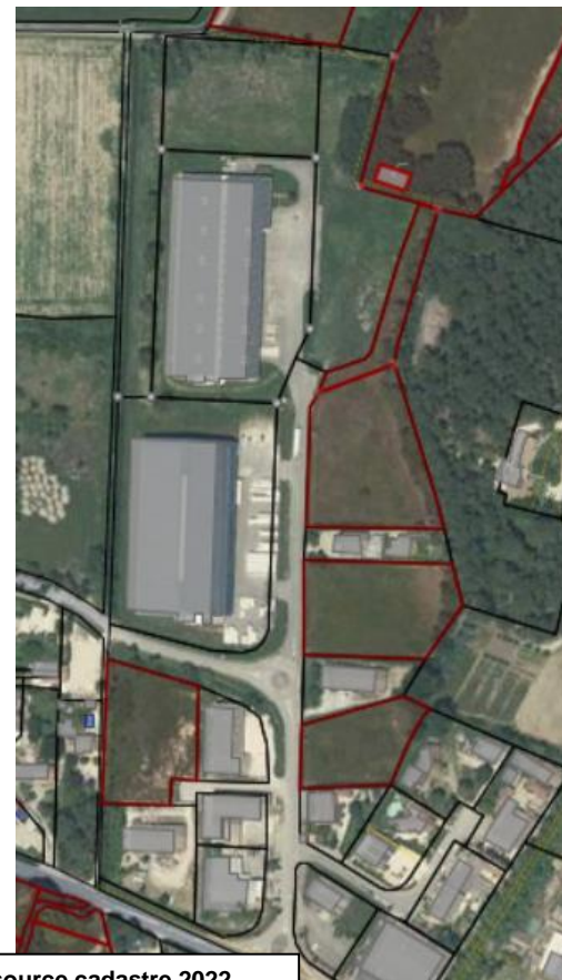
Site de la zone d'activité intercommunale du Comtat