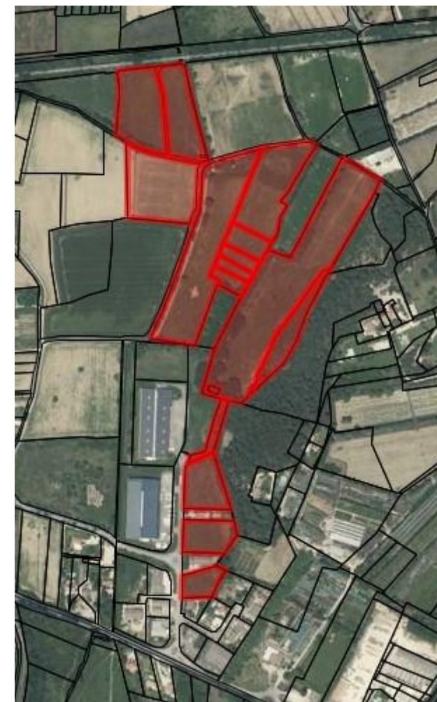
Site au nord de la zone du Comtat – source cadastre