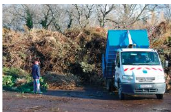
Dépôt de végétaux

Ce compost est commercialisé par la société SEDE Environnement pour le compte de la CoVe.